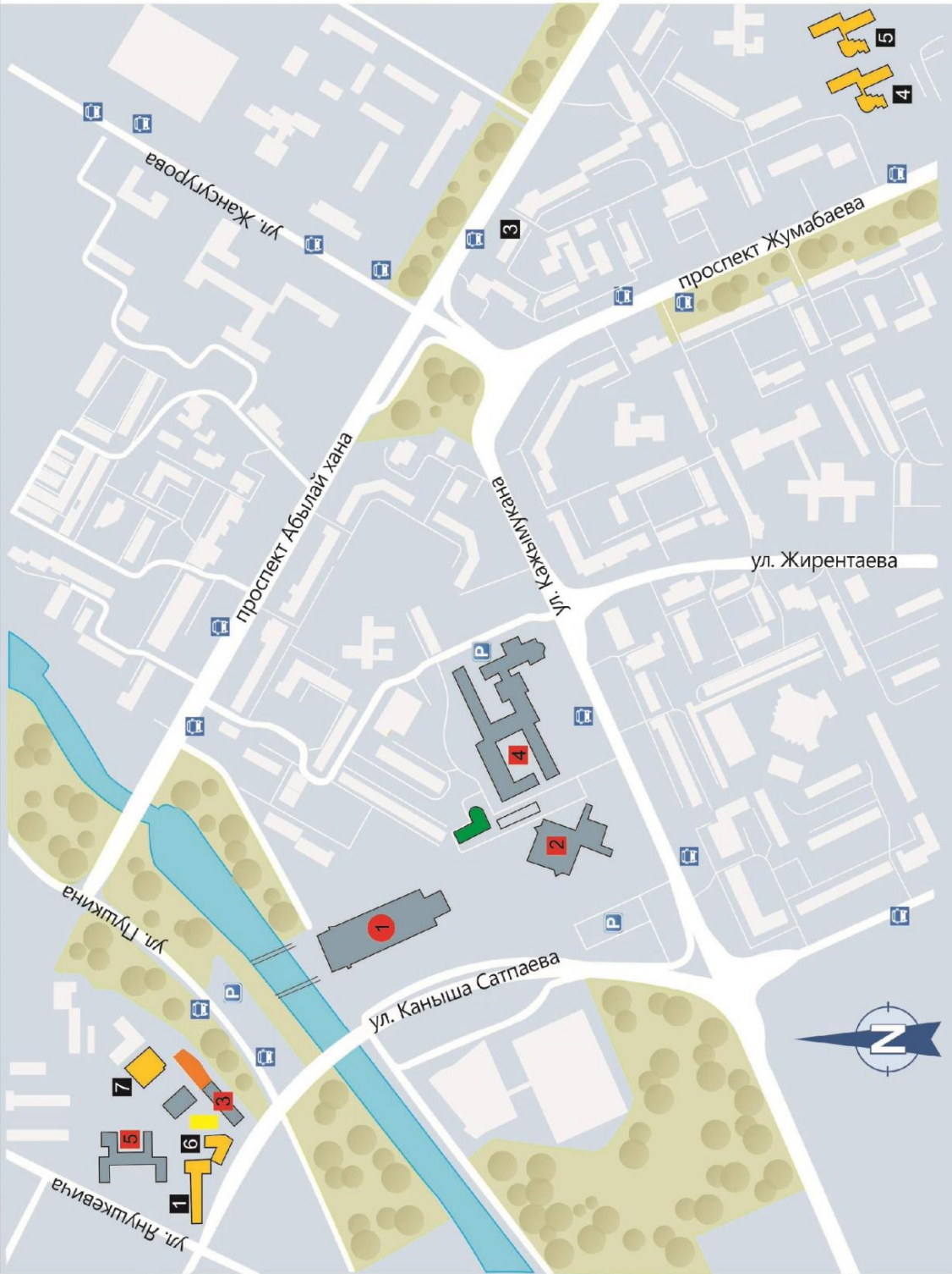
Схема расположения корпусов